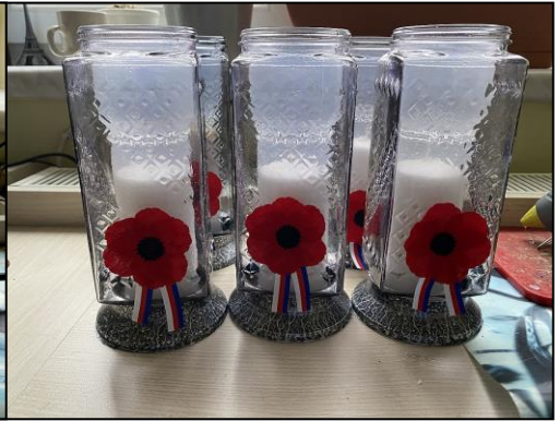
Výsledek chvilkové práce.