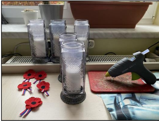
Díly před kompletací.