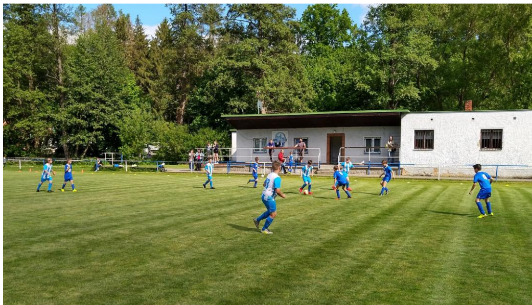
Momentka ze zápasu starší přípravky proti Dobřanům.

Čas koronavirové pauzy byl využit i pro úpravy okolí sportovního areálu. V březnu proběhlo ve spolupráci s Povodím Vltavy Plzeň pokácení suchých a nebezpečných stromů a úklid v blízkosti pláže. Dále byla vyčištěna strouha od přepadu náhonu pod jez, srovnán terén na ostrůvku a v okolí hřiště. Tyto úpravy byly v prvních hezkých dnech oceněny spontánní hrou a radostí malých dětí. Zároveň bude i příjemnou možností posezení nebo poležení ve stínu na ostrůvku při letním koupání v řece.