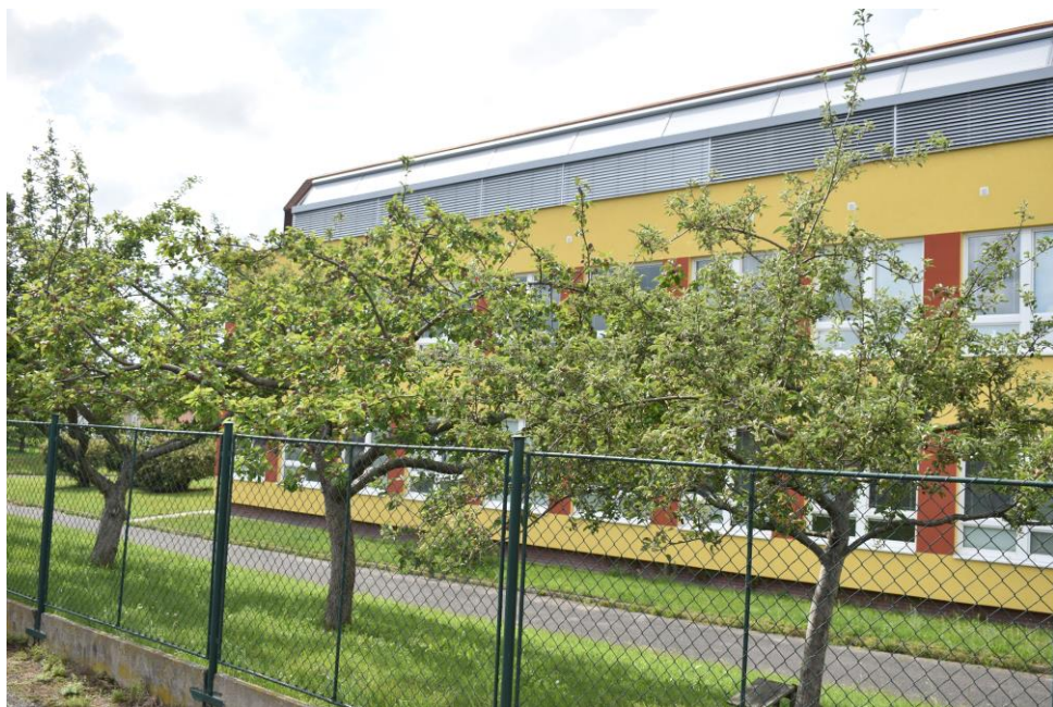
Zastínění nástavby školy.

Vlivem zastínění je pobyt v učebnách nepochybně komfortnější. Montáž rolet a žaluzií provedla firma SB SERVIS – Border Plzeň za částku zhruba 340 tis. Kč.