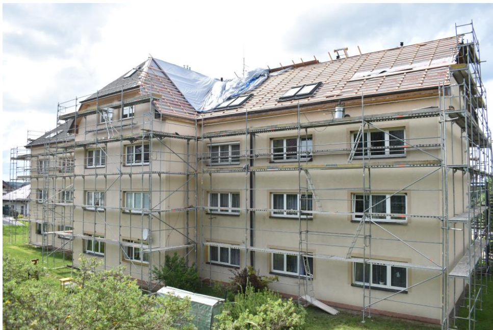
Stávající krytina bytového domu byla demontována, osazována jsou nová střešní okna.

V současné době je také zpracovávána projektová dokumentace lávky přes Úhľavu s napojením na plánovanou cyklostezku pod Malincem. Lávka však bude koncipována tak, aby mohla být standardně využívána chodci. Projekt, který by měl být dokončen letos, vyjde obec zhruba na 1 120 tis. Kč. Zpracovatelem je projekční kancelář STATICITY.