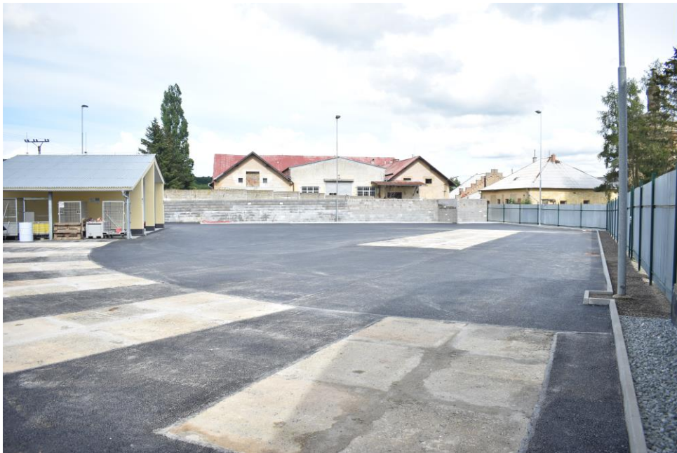
Sběrný dvůr byl značně rozšířen směrem do areálu bývalého pivovaru.

V rámci akce došlo také k rozšíření osvětlení sběrného dvora. Vzhledem k tomu, že došlo v průběhu akce k významným stavebním pracím, které nebyly součástí původního projektu, vyčíslil zhotovitel (stavební společnost W&W stavby) vícenáklady v částce zhruba 1 045 tis. Kč. Celá akce by měla obec přijít zhruba na 3 mil. Kč. Sběrný dvůr bude zprovozněn do konce června.