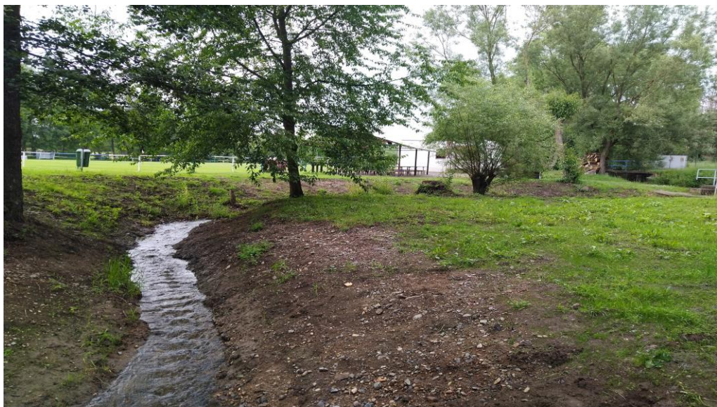
Upravená strouha po vyčištění a srovnaný terén na ostrůvku u jezu.

Sokol Štěnovice přeje všem spoluobčanům hlavně pevné zdraví a krásné léto. ■