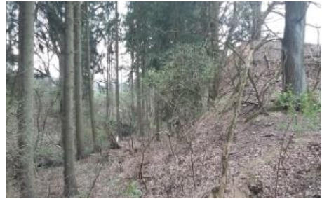
Pozemek pravděpodobného rybníku či polderu