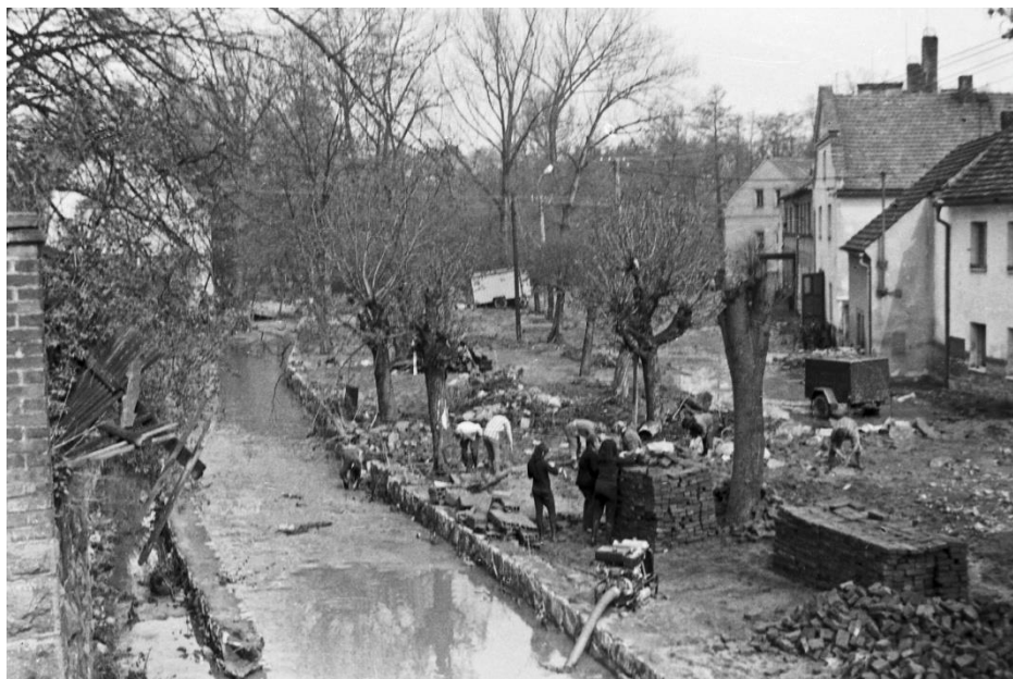
Snímek z následků povodně z 30.4.1975 ulice V Potocích