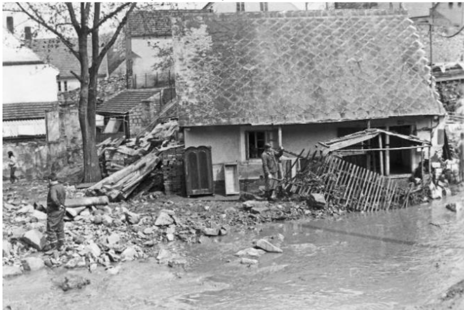
č.p. 62 - 1.5. 1975 následky po povodni z předchozího večera

V roce 1975 nebylo úplně běžné, aby měl každý po ruce fotoaparát. Proto jsou prozatím k dispozici fotografie následků povodně z druhého dne a pro srovnání s těmi letošními jsou i tak zajímavé.