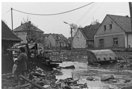
Pohledy směrem od lávky pod Lidovým domem proti proudu Losinského potoka – 2014 vs. 1975

Výše uvedené fotografie jsou z archivu Jiřího Sloupa st., který tyto fotografie věnuje obci Štěnovice pro nově budovaný archiv kroniky obce.