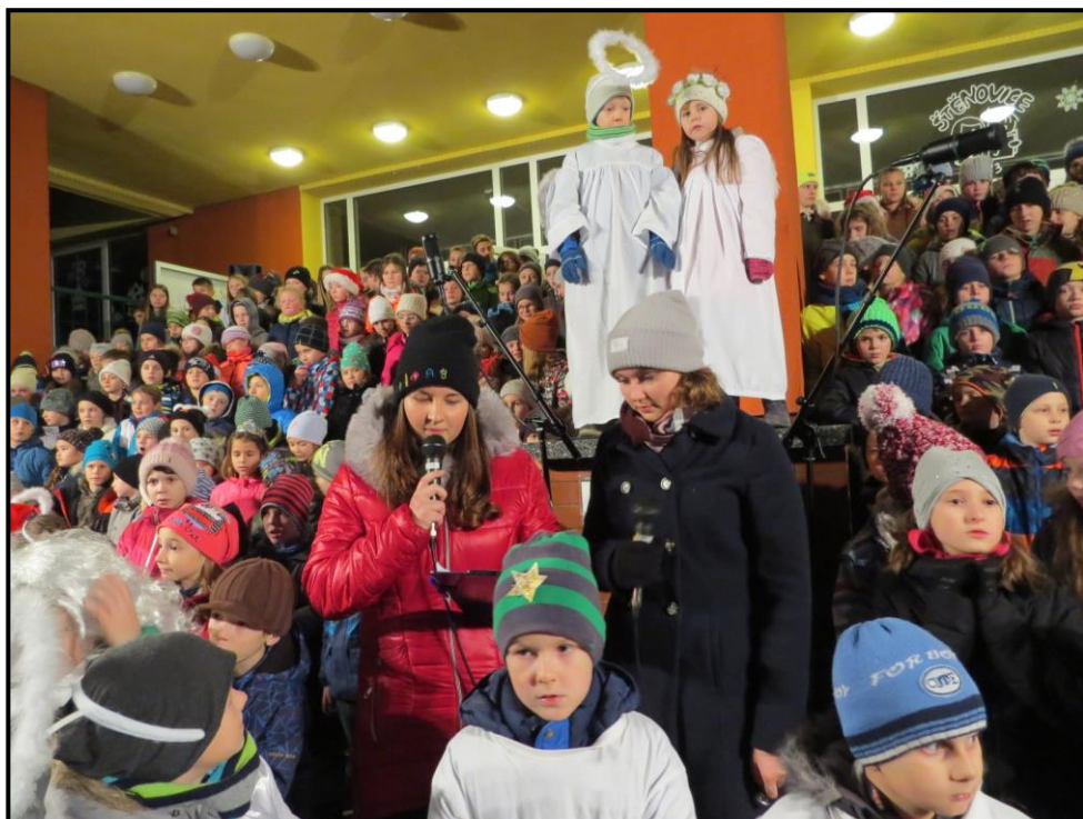
Zpívání na schodech.

Někde se na Vánoce rozkrajují jablíčka, hází střevícem, dopravá dobrot němým tvářím nebo třeba lije olovo. Ve štěnovické škole se zpívá. A zpívá se ve velkém na školních schodech.