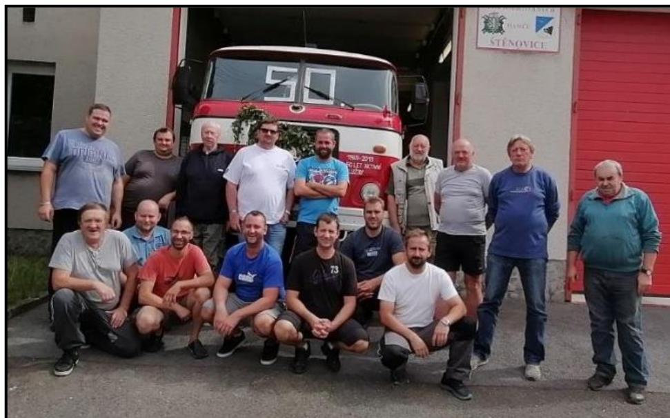
symbolická oslava k 50 letům aktivní služby vozidla Š706

Trambus v uplynulém roce oslavil 50let aktivní služby. Toto vozidlo je u našeho sboru od roku 1980. Do té doby sloužilo u SDH Přeštice. K dnešnímu dni je stále zapojeno do integrovaného záchranného systému (IZS), tzn., že je stále plnohodnotným členem výjezdové jednotky. Poslední zásah, kterého se Škoda 706 zúčastnila, byl požár chaty Pod Malincem dne 1. 1. 2020. v 01:02 hodin. O to, že je vozidlo až do