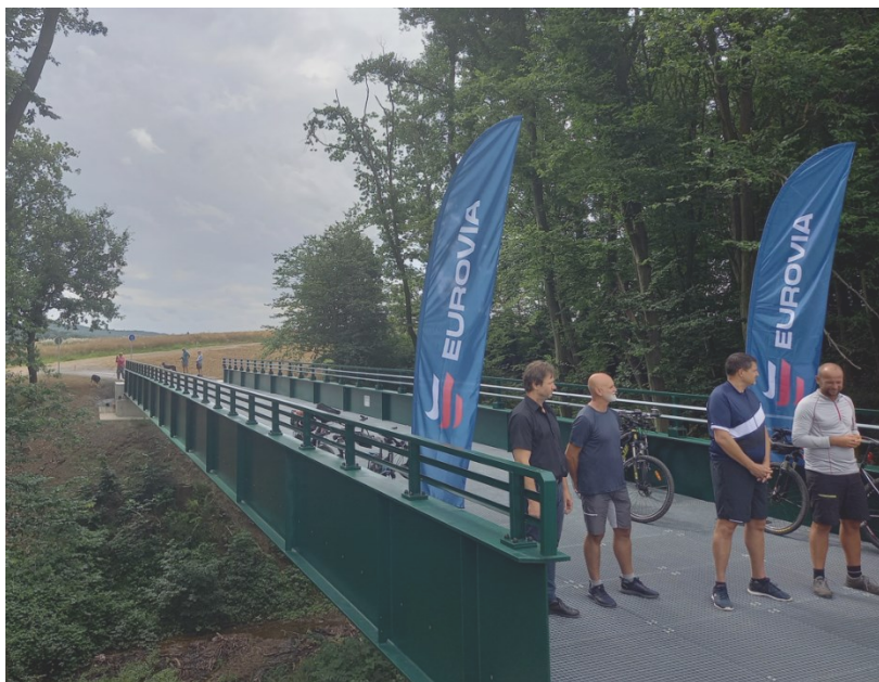
Slavnostní otevření lávky V Lahošti v Radobyčicích 17.7.2024.