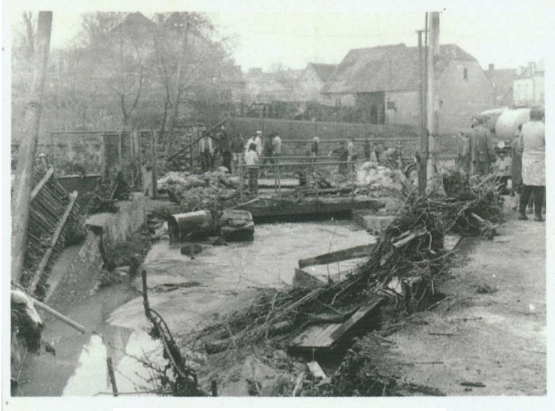
povodeň v Potocích 1975

padesáti lety a přát si, aby se události s povodní z roku 1975 a také z té loňské roku 2024 už neopakovaly. To ovšem záleží jen na nás, na lidech dnešních Štěnovic.