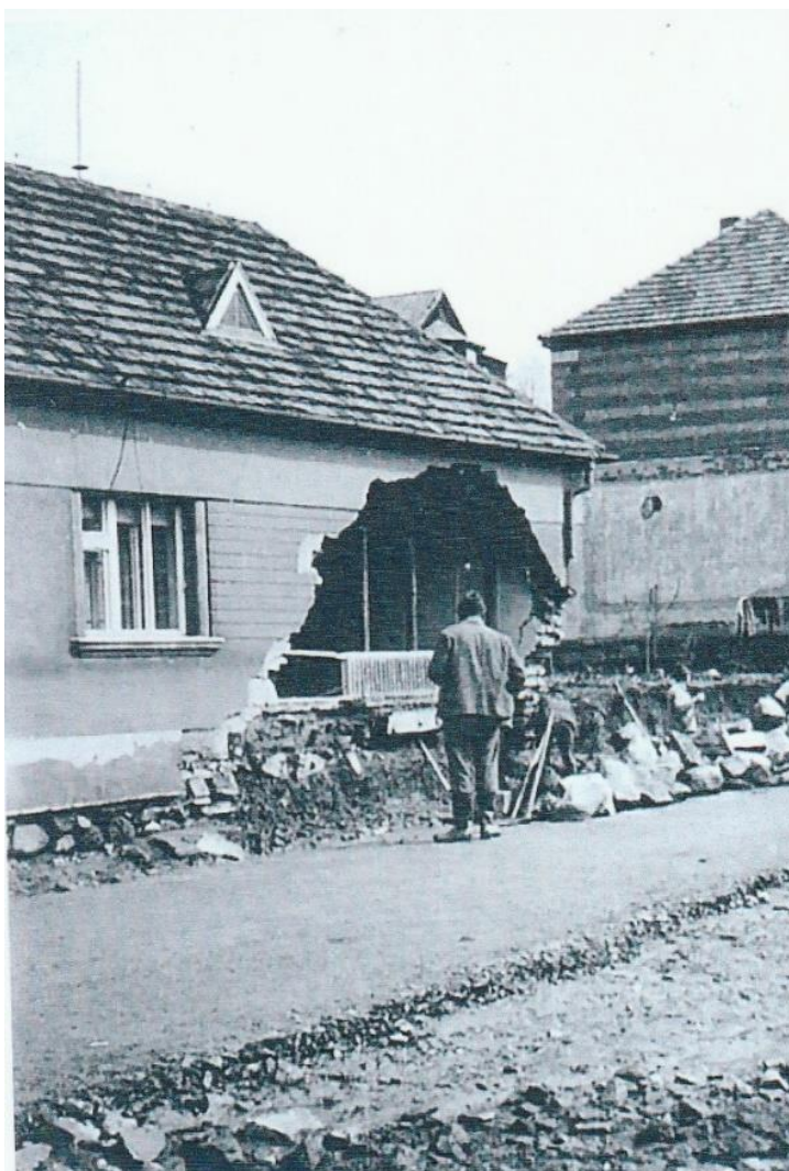
povodeň v Potocích r. 1940 před čp. 126