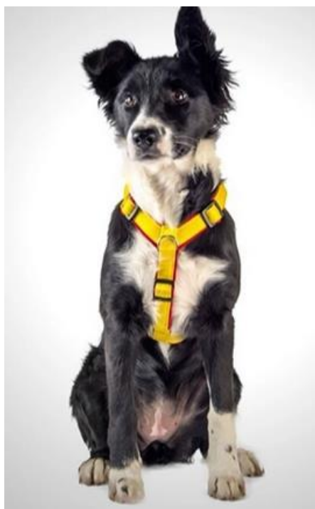
Postroj typu „Y“

V našem následujícím povídání se podíváme na typy krmení a na to, jak se vyznat ve složení stravy našich zvířecích kamarádů.