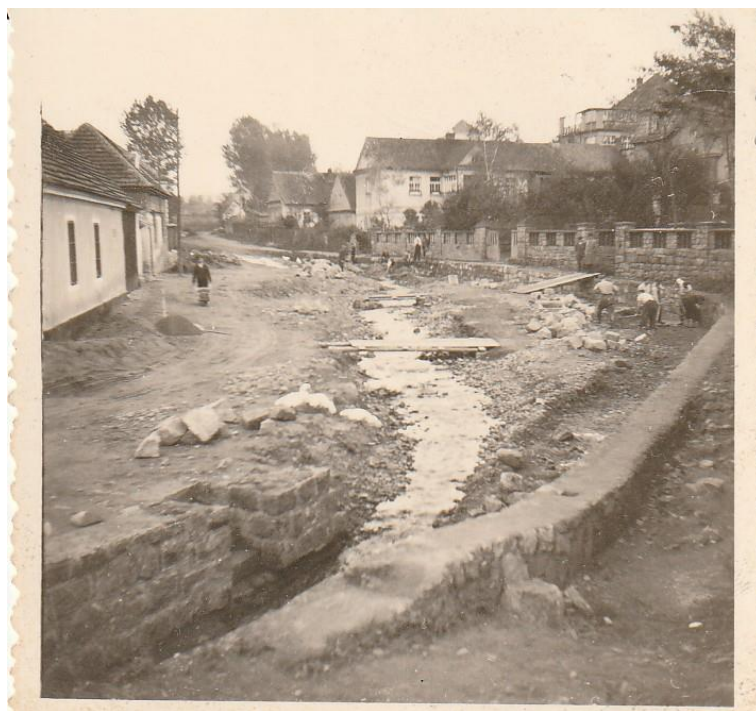
archiv AV povodeň 1975, dům, čp. 126

Nepochybně se Losinský potok občas „zbláznil“ a následně lidé bydlící v jeho blízkosti měli velké starosti. Bylo tomu tak ovšem až v době, kdy se ves stavebně rozšiřovala podél koryta potoka směrem k Černému lesu, tedy až na přelomu 19. a 20. století. V dobách dřívějších, máme na mysli 18. století a první dvě třetiny